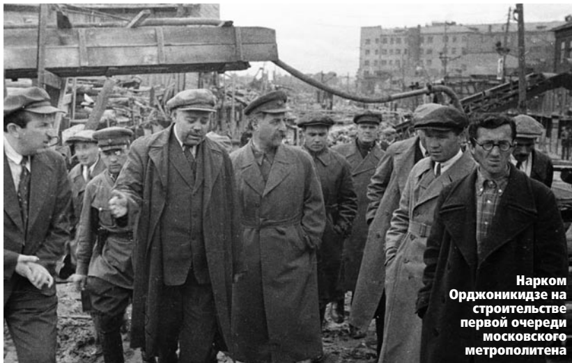
Нарком Орджоникидзе на строительстве первой очереди московского метрополитена